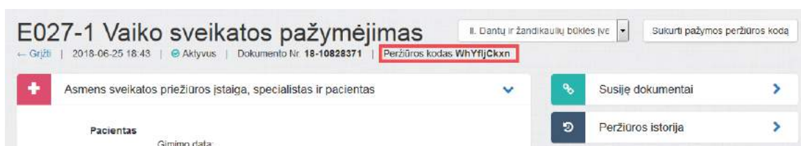
3 paveikslas. Sugeneruotas peržiūros kodas

Sistema sugeneruoja naują pažymos peržiūros e. sveikatos portale kodą, kuris parodomas atnaujintame medicininės pažymos peržiūros lange.