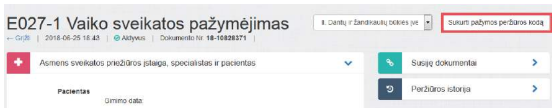
1 paveikslas. Sukurti pažymos peržiūros kodą