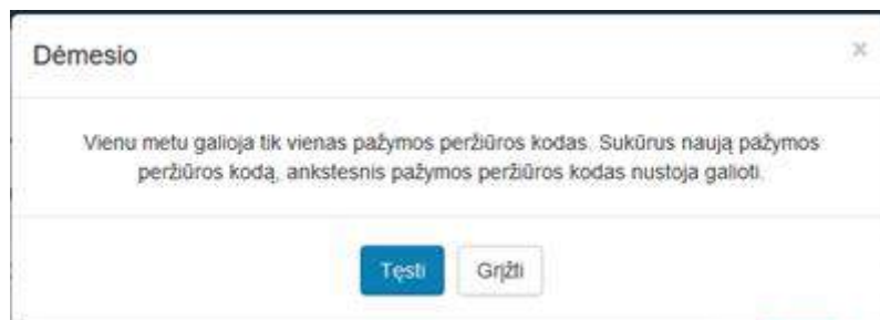
2 paveikslas. Pasirinkti tęsti veiksmą

Sistema sugeneruoja naują pažymos peržiūros e. sveikatos portale kodą, kuris parodomas atnaujintame medicininės pažymos peržiūros lange.